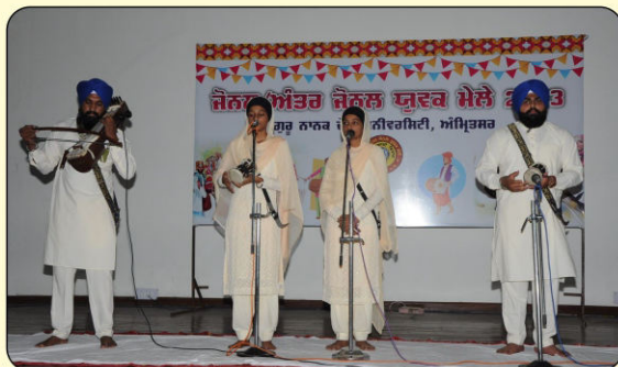
ਜ਼ੋਨਲ ਯੂਥ ਫੈਸਟੀਵਲ, ਅੰਮ੍ਰਿਤਸਰ ਵਾਰ ਗਾਇਨ ਪਹਿਲਾ ਸਥਾਨ

ਬੀ.ਏ ਭਾਗ-I (ਐਨ.ਸੀ.ਸੀ. ਕੈਡਿਟ) ਪੈਰਾ ਬੇਸਿਕ ਕੋਰਸ (ਆਗਰਾ) ਵਿੱਚ ਭਾਗ ਲਿਆ