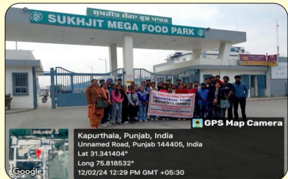
ਪੰਜਾਬ ਸਰਕਾਰ ਦੇ ਵਿਸ਼ੇਸ਼ ਉਪਰਾਲੇ ਅਤੇ ਵਿੱਤੀ ਸਹਾਇਤਾ ਦੁਆਰਾ ਕਾਲਜ ਦੇ ਵਿਦਿਆਰਥੀਆਂ ਲਈ ਆਯੋਜਿਤ ਉਦਯੋਗਿਕ ਯਾਤਰਾ (ਸੁਖਜੀਤ ਮੈਗਾ ਫੂਡ ਪਾਰਕ, ਫਗਵਾੜਾ)