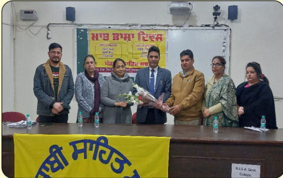
ਪੰਜਾਬੀ ਵਿਭਾਗ ਵੱਲੋਂ ਮਾਤ ਭਾਸ਼ਾ ਦਿਵਸ ਮਨਾਉਂਦੇ ਹੋਏ