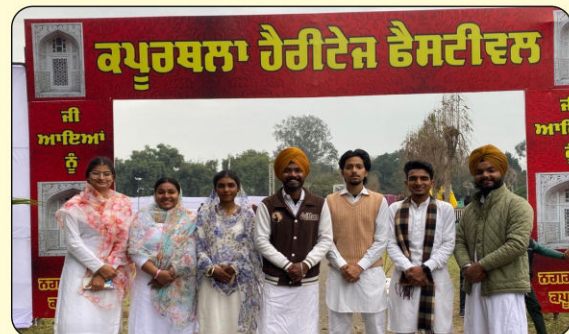
ਕਪੂਰਥਲਾ ਜ਼ਿਲ੍ਹਾ ਪ੍ਰਸ਼ਾਸਨ ਵੱਲੋਂ ਕਰਵਾਏ ਗਏ ਹੈਰੀਟੇਜ ਫੈਸਟੀਵਲ ਵਿੱਚ ਸਰਸਵਤੀ ਵੰਦਨਾ ਦੀ ਪੇਸ਼ਕਾਰੀ ਸਮੇਂ ਸੰਗੀਤ ਵਿਭਾਗ ਦੇ ਵਿਦਿਆਰਥੀ