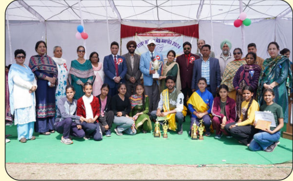
ਖੇਡ ਸਮਾਰੋਹ ਦੌਰਾਨ ਜੇਤੂ ਹਾਊਸ ਨੂੰ ਟਰਾਫੀ ਭੇਂਟ ਕਰਦੇ ਹੋਏ ਮੁੱਖ ਮਹਿਮਾਨ