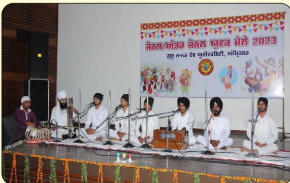
ਯੂਨੀਵਰਸਿਟੀ ਜ਼ੋਨਲ ਯੂਥ ਫੈਸਟੀਵਲ ਗਰੁੱਪ ਸ਼ਬਦ ਪਹਿਲਾ ਸਥਾਨ