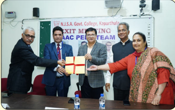
ਨੈਕ ਪੀਅਰ ਟੀਮ ਦੇ ਮੈਂਬਰ ਕਾਲਜ ਦਾ ਮੁਲਾਂਕਣ ਕਰਨ ਉਪਰੰਤ ਰਿਪੋਰਟ ਪੇਸ਼ ਕਰਦੇ ਹੋਏ