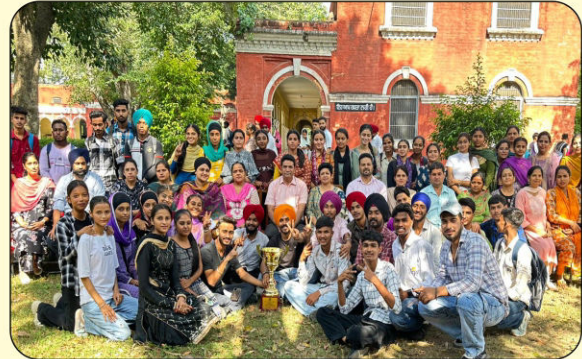
ਯੂਨੀਵਰਸਿਟੀ ਜ਼ੋਨਲ ਯੂਥ ਫੈਸਟੀਵਲ ਵਿੱਚੋਂ ਓਵਰਆਲ ਦੂਜਾ ਸਥਾਨ ਹਾਸਿਲ ਕਰਨ ਉਪਰੰਤ ਟਰਾਫੀ ਦੇ ਨਾਲ ਵਿਦਿਆਰਥੀ ਅਤੇ ਸਟਾਫ